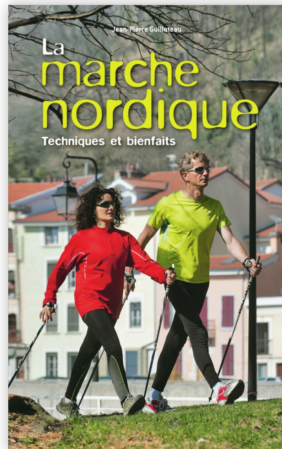
Couverture du livre